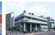
阪和住吉総合病院