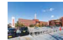
阪和第二泉北病院

阪和インテリジェント医療センターは錦秀会グループの病院をはじめ、多くの専門医療機関と連携し、万全の体制でフォローいたします。